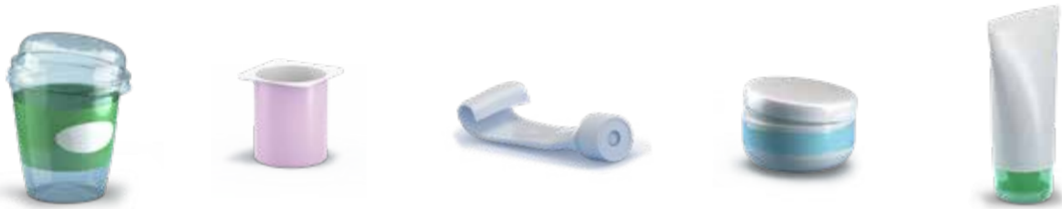
Pots et tubes • Potjes en tubes • Jars and tubes