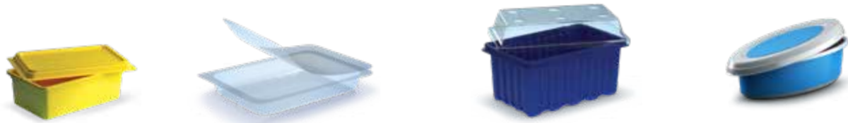
Barquettes et ravers • Schaaltjes, vloodjes en bakjes • Trays and ravers