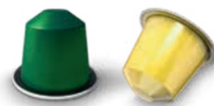
Capsules de boissons Drankcapsules Beverage capsules