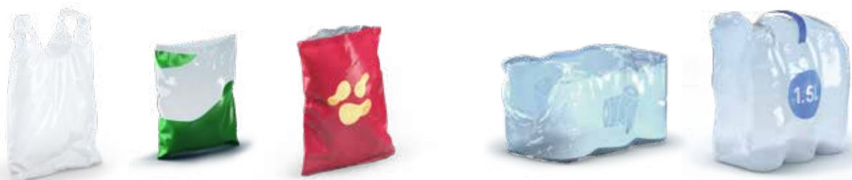
Sacs et sachets Zakjes Bags and small bags