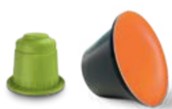
Capsules de boissons Drankcapsules Beverage capsules